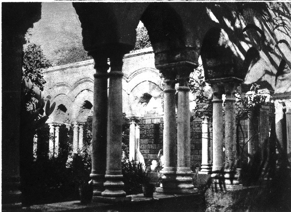
Kreuzgang der Kirche San Giovanni egli Eremiti