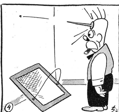
Adamson will sein Heim verschönern.

Bessy: „Du wirst es soweit treiben, daß ich davonlaufe und einen andern heirate.“