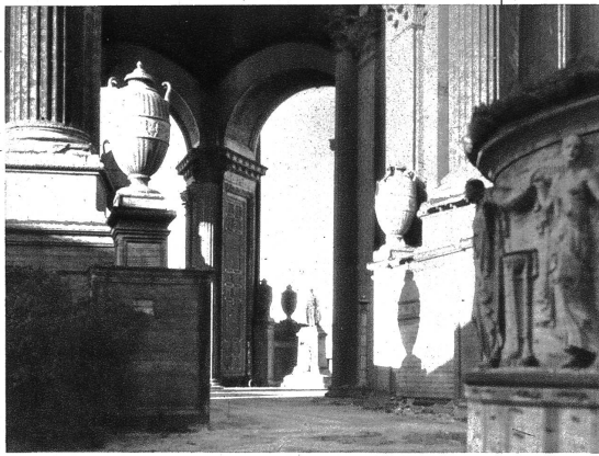
In Kalifornien scheinen sich die Stile der ganzen Welt noch einmal ein Stelldichein zu geben. Unser Bild zeigt das Kunstaussstellungsgebäude in San Francisco in seinem griechisch-römischen Stil.

Auch die Natur scheint diese Ueberlegung mitzumachen. Denn in verschwenderischer Fülle hat sie allen Reichtum des Bodens, der Landschaft und des Klimas über Californien ausgeschüttet. Der Reichtum des Landes entwickelte Städte, die in sich die Kulturen der alten Welt noch einmal zusammenfassen, das Germanische, das Romanische, und durch die Invasion auch das Ostasiatische trifft sich hier und besonders in San Francisco zu einer seltsamen Sinfonie.