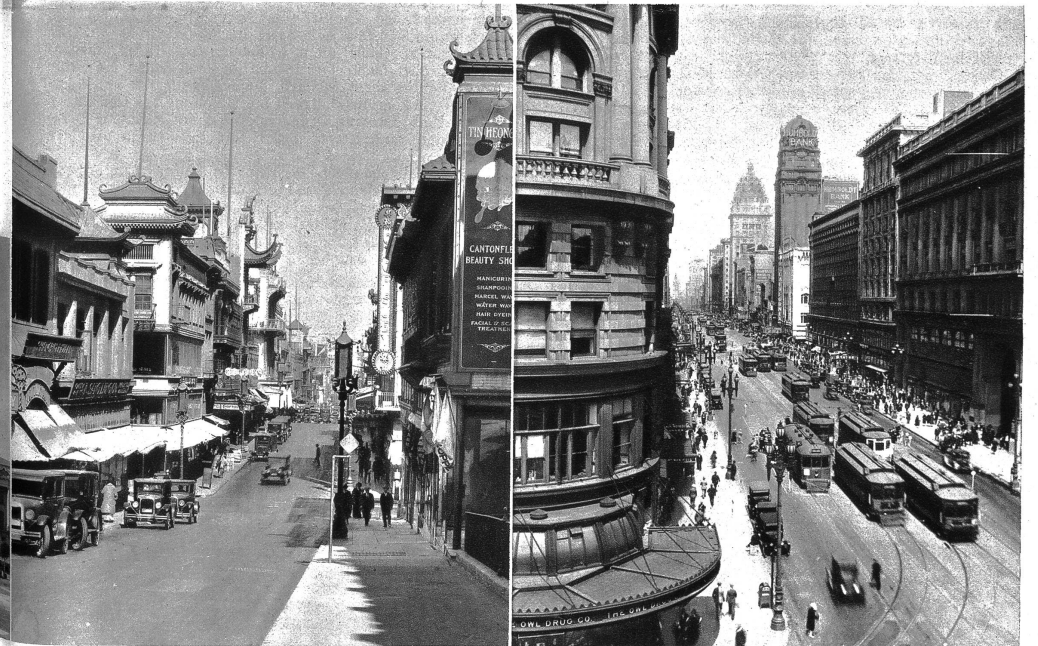
Aus dem Chinesenviertel