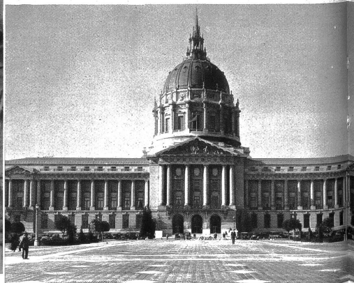
Rathaus in San Francisco