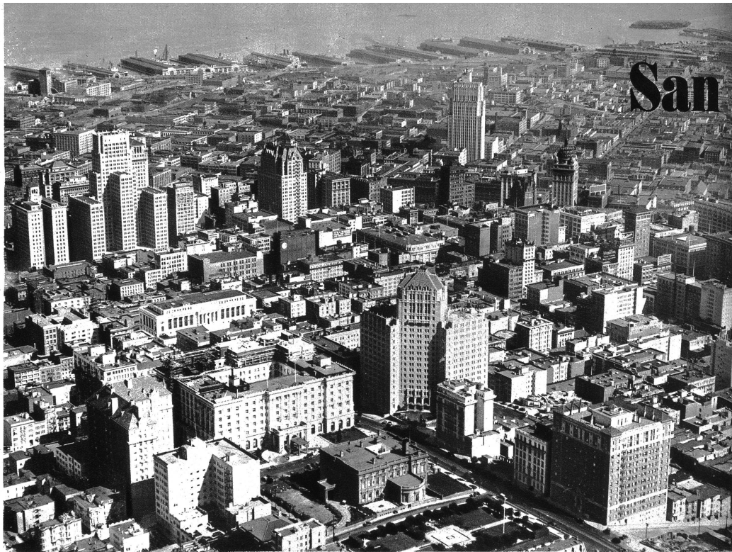
San Francisco aus der Vogelschau

Spricht man heute in Californien von New York, so sagt man: der Osten. Spricht man in New York von Californien, so sagt man: der Westen. Spricht man in San Francisco von Japan, so sagt man nicht etwa, der Westen, sondern: der Orient. Also kann man mit Fug und Recht Californien als das Ende der Welt betrachten.