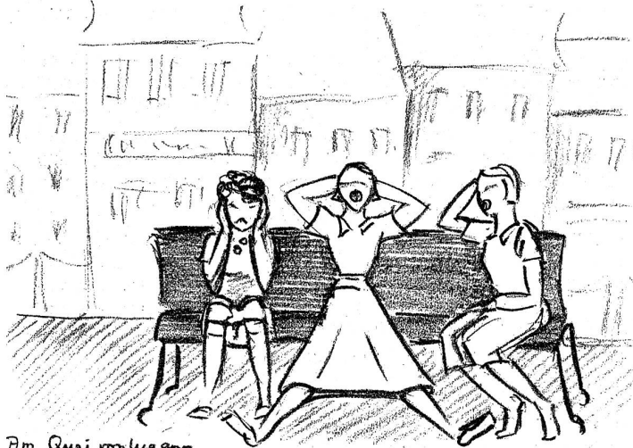
Am Quai von Lugano