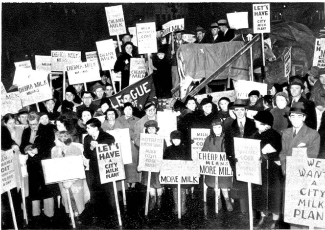
Der Schrei nach mehr und billiger Milch in Amerika. In New York fand eine öffentliche Protestkundgebung gegen die hohen Milchpreise statt, bei welcher Mütter und Kinder Plakate trugen mit der Aufschrift „Billige Milch, heisst mehr Milch“.