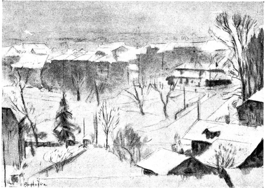
Emil Prochaska: Vorstadt im Winter. Klischee aus dem Katalog der Weihnachtsausstellung bernischer Künstler. (Besprechung der Ausstellung siehe Seite 916.)

Ein Bursche, dem die „Gemsloche“ dunkel in die Stirn hing, erschien, mit hellen Augen und einem freundlichen