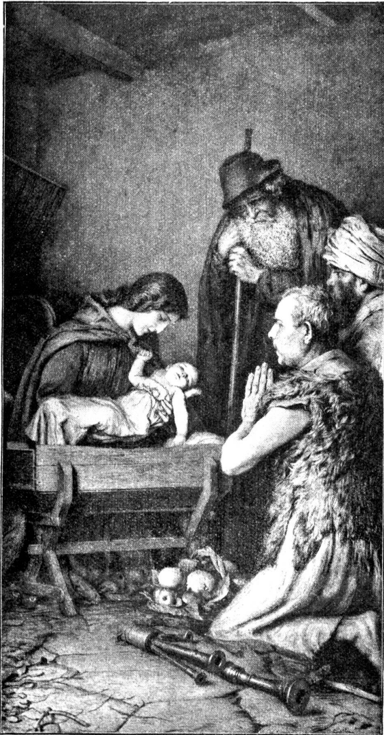
Eduard Gelli: Anbetung der Hirten.

Es waren wenige Gäste im Hotel, eine Sängerin aus Basel, skifahrende Pärchen aus dem Unterland und die