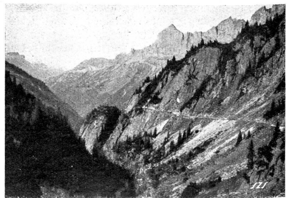
„In der Höll“. Blick talauswärts gegen „Bäregg“ (Hintergrund Gadmerflühe).

Die militärischen Notwendigkeiten, die sich aus der Bedrohung unserer Grenze durch die gegenwärtige politische