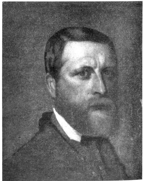
Barthélemy Menn: Selbstbildnis.

Wohl sind den meisten, die zu ständigen Besuchern der bernischen Kunstausstellungen geworden sind, von jeher die