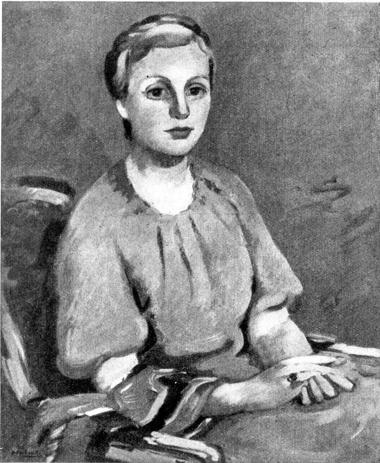
Ernest Hubert, „Portrait“. (Oelgemälde.)

stande war, die Leute neugierig, eifrig und erregt zu machen, es dies war, daß der Ring wiedergefunden und wieder verloren worden war, daß man Ingilbert tot im Walde gefunden hatte, und daß die Olsbyleute jetzt in dem Verdacht standen, sich den Ring angeeignet zu haben, und im Gefängnis saßen. Als die Kirchenbesucher Sonntag nachmittag heimgewandert kamen, konnte man sich kaum so lange gedulden, bis sie die Kirchenkleider abgelegt und einen Bissen genossen hatten, sie mußten gleich von allem erzählen, was ausgesagt, und allem, was eingestanden worden war, und was man wohl glaubte, zu welcher Strafe die Angeklagten verurteilt werden würden.