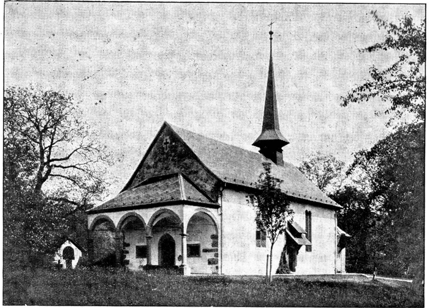
Die Schlachtkapelle bei Sempach.

Als die Ritter den Tod ihres Führers sahen, gaben sie die Schlacht verloren, riefen nach ihren Pferden, doch hatten sich die Knechte schon früher damit davongemacht.