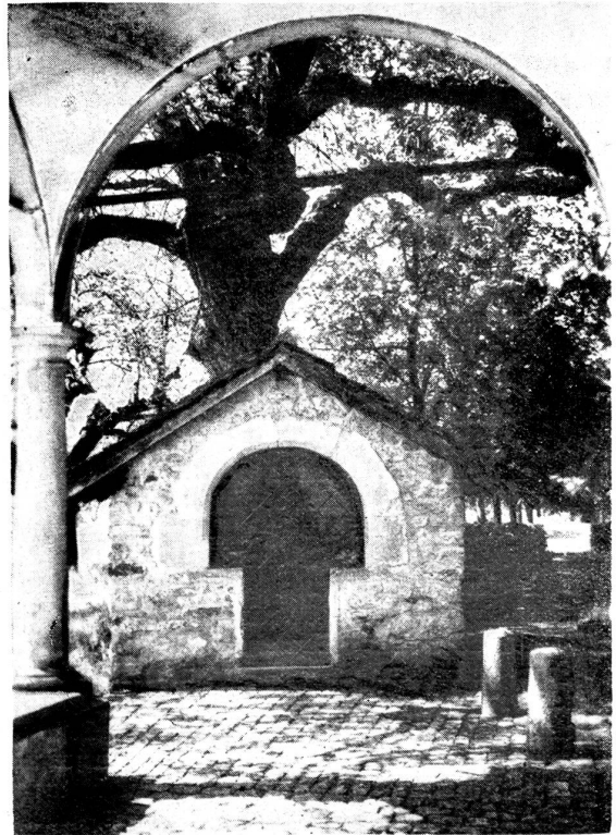
Durchblick auf das alte Beinhaus bei der Schlachtkapelle.

Die mittlere Kolonne der Desterreicher stieß am Willisbach auf eine Leze. Es entspann sich ein kurzer Kampf. Die Eidgenossen wurden zurückgedrängt. Aber auf dem Plateau von Meyerholz, das von Wald und Bächen durchzogen ist, stießen die Desterreicher unvermutet auf das eidgenössische Heer. Der kriegslundige Herr von Hasenburg riet angesichts des ungünstigen Geländes für eine Schlacht zum Rückzug auf Sursee, aber die Ansicht des Johann von Ochsenstein, den Kampf anzunehmen, drang durch.