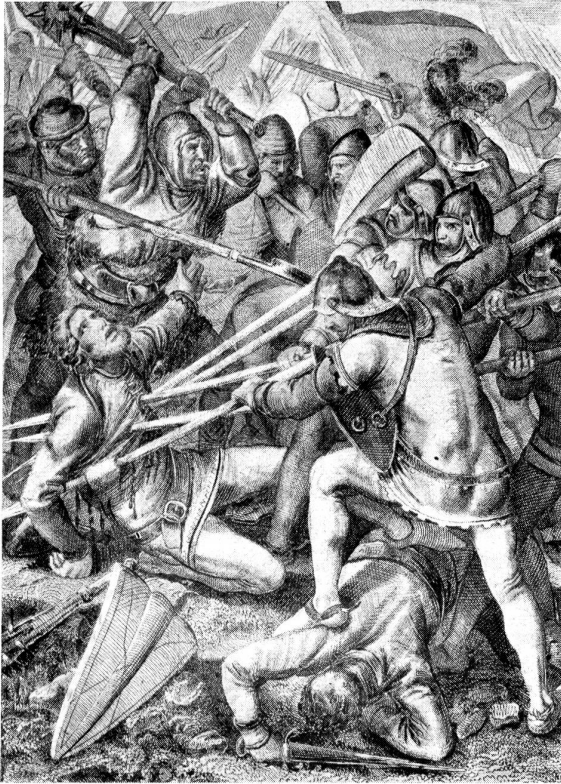
Die Schlacht bei Sempach. Nach einem alten Stich in der Sammlung der Schweiz. Landesbibliothek.

eilten ihm denn auch zu. In der Zwischenzeit erwarb er die Stadt Lauffenburg, stand mit den Grafen von Kyburg in