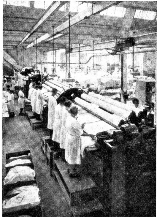
Vier große Bügelmaschinen für Flachwäsche.

sodas jeder Binder tadellos gleitet. Eine Beruhigung für die wichtigste Frage einer stets aufgeregten Männerwelt.