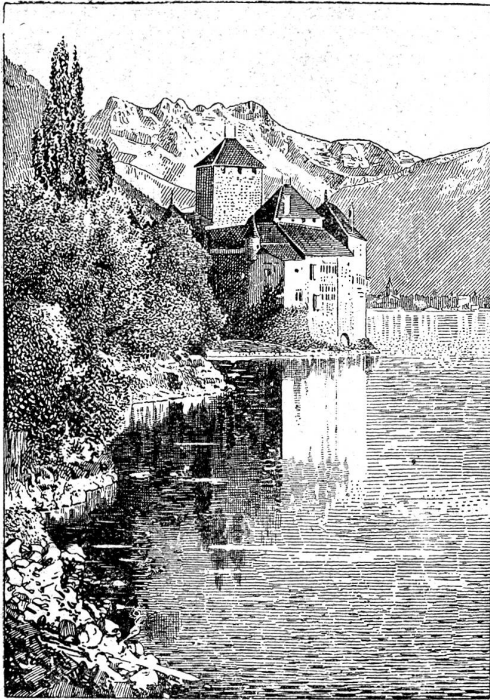
Schloß Chillon. Nach einer Zeichnung.

mehrere Landvogtbezirke eingeteilt und einem gemeinsamen Generalsfeldmeister unterstellt. Doch verliehen die Berner dem Waadtland bedeutende Vorrechte, ganz besonders Lau-