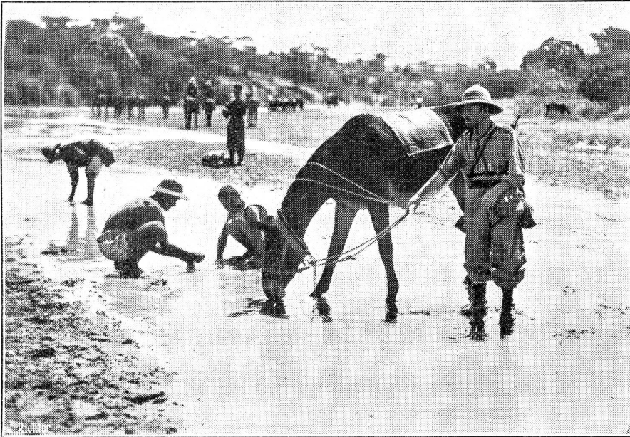
Vom Kriegsschauplatz in Abessinien. Menschen und Tiere erfrischen sich jedesmal, wenn das Glück sie an einen Fluss führt.

Neben einem Flügel vor Dschischiga mit Gesicht nach Süden steht irgendwo ein anderer mit Gesicht nach Osten, und man weiß nicht einmal, ob der verschanzte Posten bei Gorrahei in dieser Front oder noch östlicher kämpft. Bisher hat er sich gegen die Bomben gehalten und den italienischen Erkundungsvorstößen verwehrt, weiter nach Westen zu dringen, um den gegnerischen Aufmarsch zu studieren.