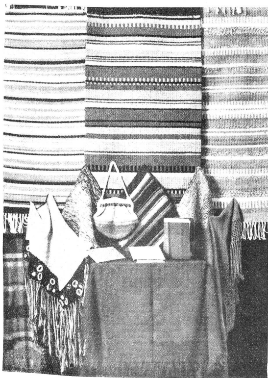
Handwebereien aus dem Simmen- und Frutigtal.

Sein Erbauer war Abbé A. Ebenrecht, der 1872 geboren wurde, am 16. Juni 1927 in Straßburg starb und in Hofsheim begraben wurde. Schulkinder halfen dem Priester beim Bau des Denkmals. Ohne irgendwelche Entschädigung wirkten nach Feierabend beim Bau dieses eigenartigen Soldatendenkmals die Arbeiter des Dorfes mit. Bauern befragten kostenlos alle Führungen. Im Jahre 1921 wurde der Bau vollendet; er dauerte viereinhalb Monate. Im ganzen Dorfe wurden Geschirrscherben gesammelt und überall am Denkmal mosaikartig eingelegt. Selbst die vielen Sockeln der Umzäunung leuchten in dieser reizvollen Buntfarbigkeit. Man verwendete außerdem einen rötlich gefärbten Lehm. Sogar die vielen Sprüche religiösen Inhalts und die übrigen Aufzeichnungen sind eingelegt. Eine Sisyphosarbeit sondergleichen! Die Inschriften berichten auch über die Zahl der Gefallenen und über die Zahl der im Exil Verstorbenen. Die jüngste Person, die im Exil starb, war 7 Jahre alt und die älteste zählte 89 Jahre. Das Denkmal ruht auf einem Fundament, das eine Dide von einem Meter hat. Zuerst auf dem Denkmal befindet sich ein Kreuz mit einer Christusfigur. Fünf Meter hoch ist dieses Kreuz und hat das respectable Gewicht von vier Zentnern. Auf