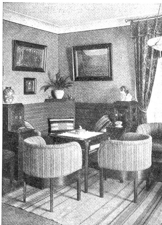
Anwendung der handgewebten Stoffe und Teppiche.

Seit ungefähr vier Jahren folgte auch Zweisimmen dem Vorbild von Oberhasli und Saanen, indem es mit der Handweberei von Tischtuchstoffen und Fladteppichen, den sogenannten „Hudlen“, begann. Spezialität aber wurde die Herstellung von Vorhangstoffen, die ganz nach eigenen Entwürfen und Mustern gewoben, in jeder bestellten Farbe, absolut licht- und waschecht zu haben sind. Nebenbei verfertigen die Zweisimmer Bäuerinnen reizende Schürzchen, bunte, sehr strapazierfähige Kinderkleidchen, Einkaufstaschen, Hand- und Küchentücher. Wunderhüßlich