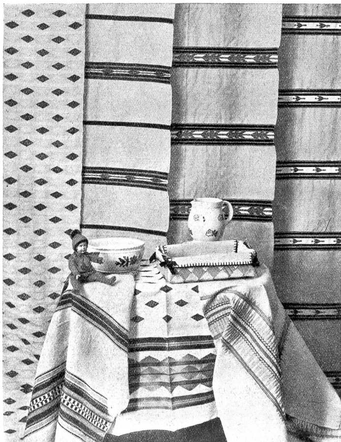
Tischdecken und Stoffe aus dem Simmen- und Frutigtal.