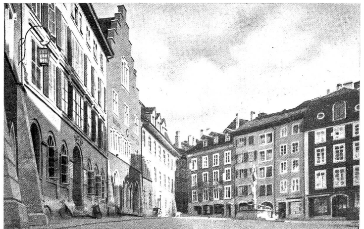
Biel. Die Burg.

Schweizer Vielfalt, Art und Wollen, Schweizer Wechsel an Kräften und Geschichte, Schweizer Selbstbehauptung und Schweizer Troß ... all das offenbart sich in den einzelnen Stämmen und Landschaften anders; oft lebt es nur für sich und unter der Oberfläche. Oft spricht es mehr aus den Zeugnissen großer Bergangeneit, und die Gegenwart: ist ein bißchen verträumt — unwirklich — so Murten, Solothurn, Zug. — Oft aber ist alles frühlingsschnell aus dem Boden gewachsen und blüht in heißer Fülle, steht im Zeichen schaffender Wirklichkeit — so Zürich. Seltener, daß Gestern und Heute in einer Stadt so ganz Einklang sind! Selten, daß neben winklig-dämmerigen Gassen die Wucht mächtiger Zeugnisse des Augenblicks mit gleichem Daseinsrecht sich reckt! Was den Vielklang all dessen, was man als Schweizer Wesen anspricht, angeht — in Biel tönt es voll und rein! Man darf um die geistige Bedeutung Berns, um die künstlerische Basels, um die handelspraktische und handelspolitische Zürichs wissen — man soll anerkennen, wo immer unsere starr gewordene Zivilisation von spru-