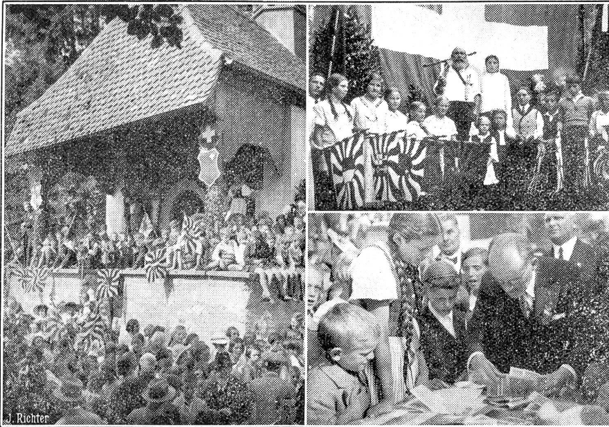
Die Hohle Gasse der Schweizer Jugend.

Bei der Tellskapelle in der Hohlen Gasse bei Küsnacht fand der Uebergabeakt der Sammlung unter der Schweizer Schuljugend für die Erhaltung dieser historischen Stätte statt. Rund 103,000 Franken wurden dem Stiftungsrat der Gesellschaft ausgehändigt in Anwesenheit der Küsnachter Schuljugend, die als Vertreter der gesamten schweizerischen Schuljugend figurierte. Durch diese Sammlung unter der Schweizer Schuljugend ist die Erhaltung der historischen Hohlen Gasse gesichert.