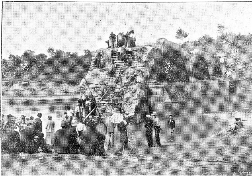
Der Dambruch bei Ovada (Italien). Unser Bild zeigt eine der vier eingestürzten Brücken.

Ein wunderbare isch mer gsi wie dr Pilot i mene fettige Näbel si Wäg gfunde het. U d'Frag het mi bsunders beschäftigt wägem Lande. Mi cha ja ganz sicher mit eme Kompaß stüre. I ha mer la erzelle, wi me uf drahtlosem Wäg chönn em Pilot Zeiche gä, daß dä geng ganz genau wüß, wo ner sig, was er mache müeß. Er sig geng mit ere Bodestation i Verbindig und drum chönn er so sicher da obe i de Lüfte si Wäg suche. Mir hei üse Wäg a Bode abe nid müeße im Näbel sueche. Es het wieder ufta, wo mer gäge d'Schwiz cho si. I weiß nid wie mers gange isch. I ha so viel gseh, daß i ganz erstunt gfragt ha, was isch das für e große Strom da unde? Mi het mer gantwortet: He, dr Rhj. Tä und de die große Stadt mit dene Brügge u Chilchsturm, isch das scho Basel? Wahrhaftig, es isch halbi sächsi gsi u mir sie wieder i nere elegante Schleife uf e Bode cho. Kei Minute zfrüh u keini zspät. I bi ganz überrascht gsi über die Pünktlichkeit.