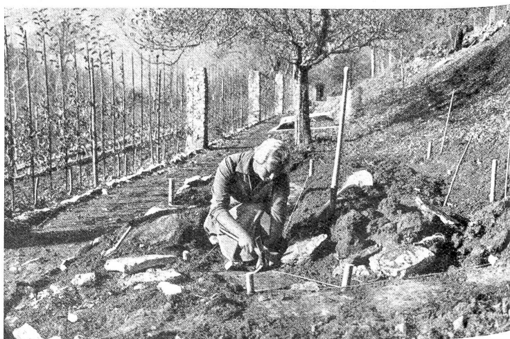
Werktätige Uebung beim Legen von Plattenwegen. Der neue Gewürzgarten wird angelegt.

Es ging aber auch etwas Mütterliches, Starkes von dieser Frau aus, die gleichsam die Seele auf der Alp und die vorbildlichste unter allen Arbeitskräften war. Nie sah man sie untätig und auch nie mißmutig, obschon ihr das