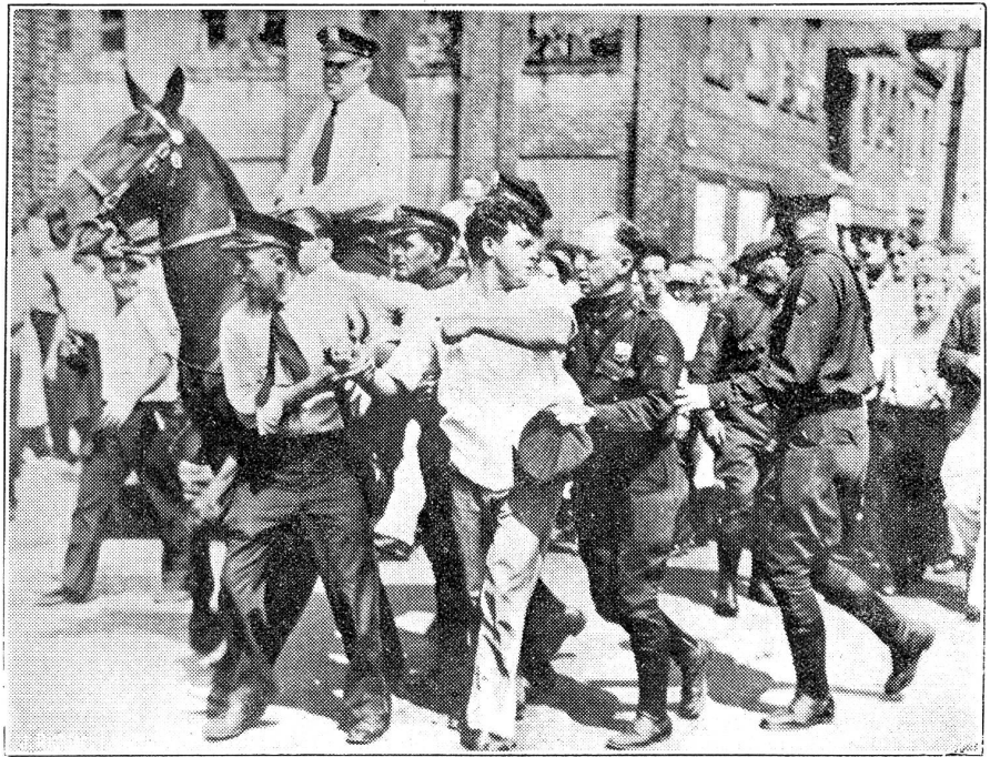
Streik in einer Strumpffabrik in Philadelphia, U. S. A.

Wer aber, so fahren sie weiter, hat alles Interesse, uns zu blamieren? Wer hofft, daß die Arbeitermassen einzig, das Bündnis zwischen Radikalen und Marxisten