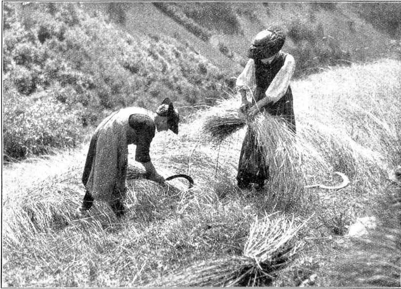
Roggenernte im Val d'Hérens. Auch während der Feldarbeit trägt die Evolenerin ihre schmucke Tracht.

knack hätte, so wäre es weder dem Leu, noch Königlis Karli eingefallen, mit einem Bündholz in die Weste hinaufzuleuchten, als die in ihren Halbräuschen von der Bann herabkamen. Die haben aber anders über Euch losgezogen! Wenn ich nur die Hälfte davon ausbringen wollte, so gäbe es einen Prozeß.“