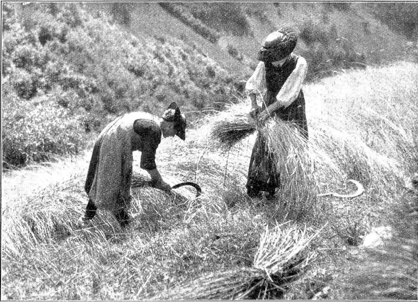
Roggenernte im Val d'Hérens. Auch während der Feldarbeit trägt die Evolenerin ihre schmucke Tracht.

knackt hätte, so wäre es weder dem Leu, noch Königlis Karli eingefallen, mit einem Bündholz in die Weste hinaufzuleuchten, als die in ihren Halbräuschen von der Bann herabkamen. Die haben aber anders über Euch losgezogen! Wenn ich nur die Hälfte davon ausbringen wollte, so gäbe es einen Prozeß.“