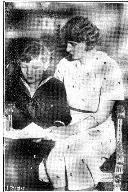
Die Gattin des österreichischen Bundeskanzlers, Frau Herma von Schuschnigg, die kürzlich bei einem Autounfall ums Leben kam, mit ihrem 9jährigen Sohn.

In Lyon hat Herriot den Kommunisten eine Vorlesung über ihr Betragen ihm und den Linksbürgerlichen gegenüber gehalten. Das „ferne Land im Osten“ bereitete