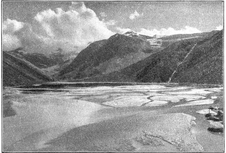
Der Mattmarksee am Monte Moro-Pass.

So haben wir die hauptsächlichsten und einft weitaus gefährlichsten Walliser Gletscherseen geschildert. Es soll uns alle freuen, daß der geniale Einfall eines Einzelnen und der freundeidgenössische Sinn die Walliser von der fürchterlichen Plage der Gletscherseen befreiten. Noch bereiten ihnen die Rufen und die Lawinen schwere Sorgen genug.