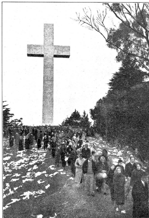
Mt. Davidson in San Francisco, mit dem neuen Kreuz: 30 m hoch 12 m breit. (Nach der Osterfeier 1934.)

eingehalten, ohne daß diesen eine wilde Fastnacht vorangegangen wäre.