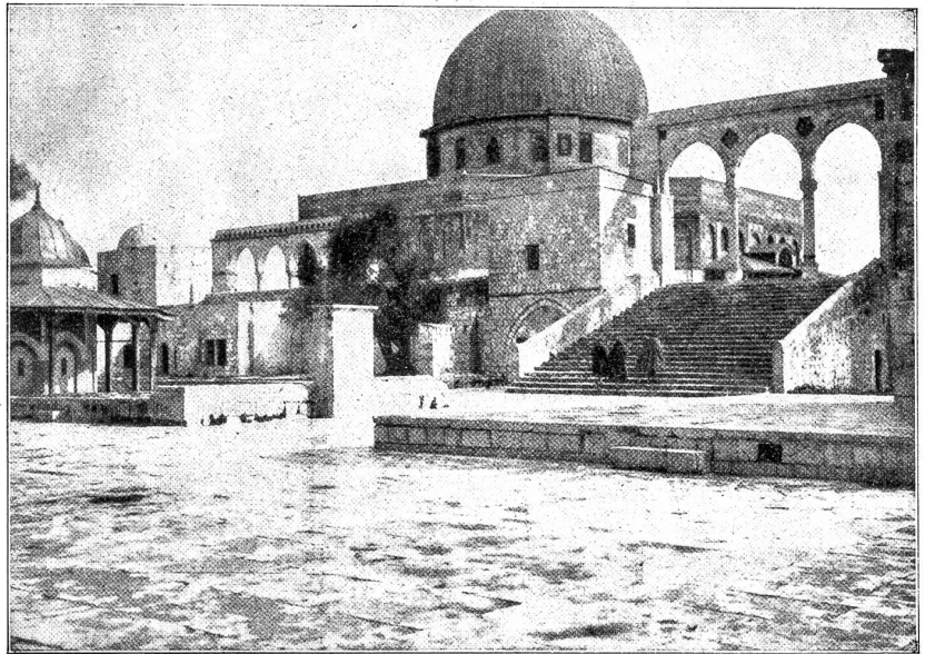
Der Felsendom in Jerusalem.

Die Sonne glühte unbarmherzig auf uns nieder. Die Tiere stiegen anfangs widerwillig, später in gefügigem Trott, den steilen Felsenweg aufwärts. Die Mulakis liefen wie haltige Schatten nebenher. Als wir uns gegen 2 Uhr nachmittags dem Berggipfel näherten, kamen uns schon viele heimkehrende Touristen entgegen. Wegen des Freitags hatte die Zeremonie früher als sonst begonnen. So war ein Teil des Opferfestes schon vorüber, doch kamen wir gerade zurecht, als die Samaritaner das geschlachtete Lamm auf einem Spieße befestigten. Dann brieten sie es über dem Holzfeuer eines offenen Herdes, der in den Erdboden gegraben war. Die Eingeweide wurden verbrannt. Die we-