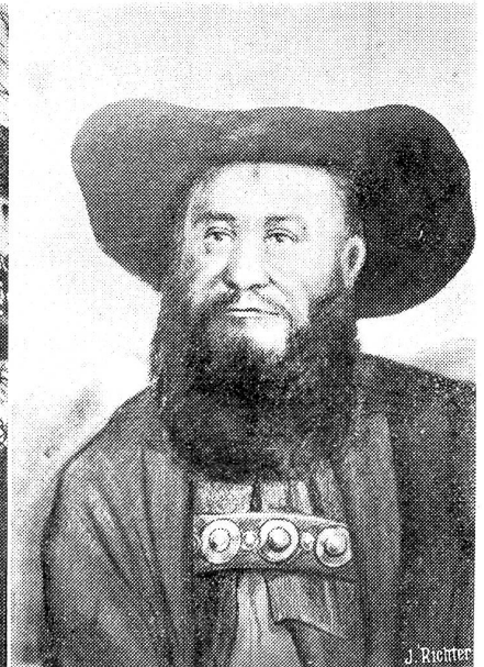
Zum 125. Todestag Andreas Hofers am 20. Februar 1935.

Links: Andreas Hofers Geburtshaus, das Wirtshaus „Am Sande“ zu St. Leonhard im Passeiertal. Rechts: Der Tiroler Freiheitsheld Andreas Hofer.