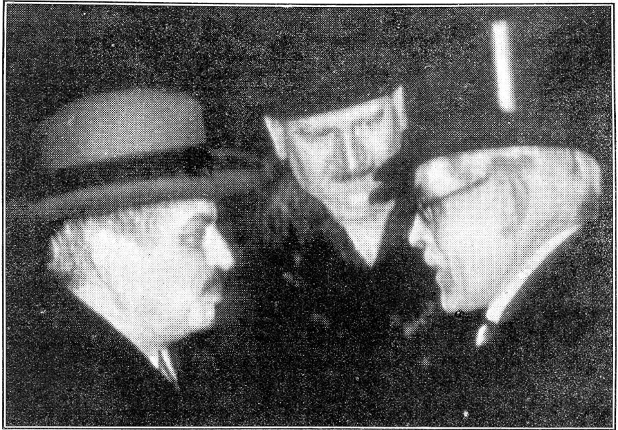
Mac Donald begrüßt Flandin und Laval in London.

Die britischen und französischen Minister haben sich geeinigt und schlagen Berlin, Rom und Brüssel vor, sich dieser Einigung anzuschließen; damit scheinen die Engländer ihrem Ziele, das Dritte Reich wieder nach dem Völkerbundsitz und an die Abrüstungskonferenz zu manövrieren, näher gekommen zu sein. Aber die Einigung der Westmächte hat einen Haken, und dieses Hafens wegen weigern sich die Deutschen zunächst, anzubeißen. So liegt zur Stunde kein Grund vor, an mehr zu glauben, als an eine weitere Verstärkung der französischen Position, und nicht die Engländer, sondern die Franzosen hätten demnach ihre Ziele erreicht. Mit andern Worten: England möchte Deutschland ins Konzert der Mächte zurückführen, Drittes Reich hin oder her. Deutschland widersteht. Dadurch bildet sich automatisch eine engere Verbindung zwischen London und Paris, die gegen Deutschland geht. Und gerade dies ist es, was den Franzosen angenehmer scheint.