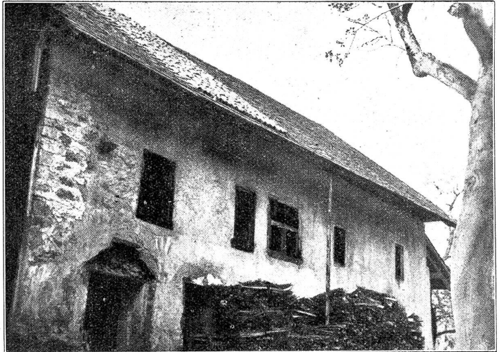
Südfassade der einstigen Kirche von Kleinhöchstetten.

Nach der Reformation wurde die Pfarrei Kleinhöchstetten aufgehoben und anno 1534 die Kirche an den Landwirt Sulpitius Ruffbaum verkauft. Der Predikant Georg Brunner, der schon lange vor der Disputation reformatorisch gewirkt hatte und deshalb beim Kirchherrn von Münsingen in Ungnade verfallen war, erhielt ein Leibgeding. Im Mittelalter war das schön gelegene Dorf Kleinhöchstetten ein vielbesuchter Wallfahrtsort. Das altehrwürdige Gotteshaus, eine Filiale von Münsingen, soll der Sage nach von einem heil aus den Kreuzzügen zurückgekehrten Ritter ge-