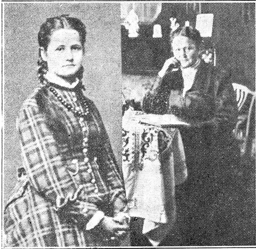
Die Lindenwirtin — 75 Jahre alt.

geiftigen Auge die „junge Lindenwirtin“ in all ihrer Lieblichkeit. Für den einen schwarz und dunkeläugig, für den andern blond mit Blauaugen, denn vor jedem der lauten