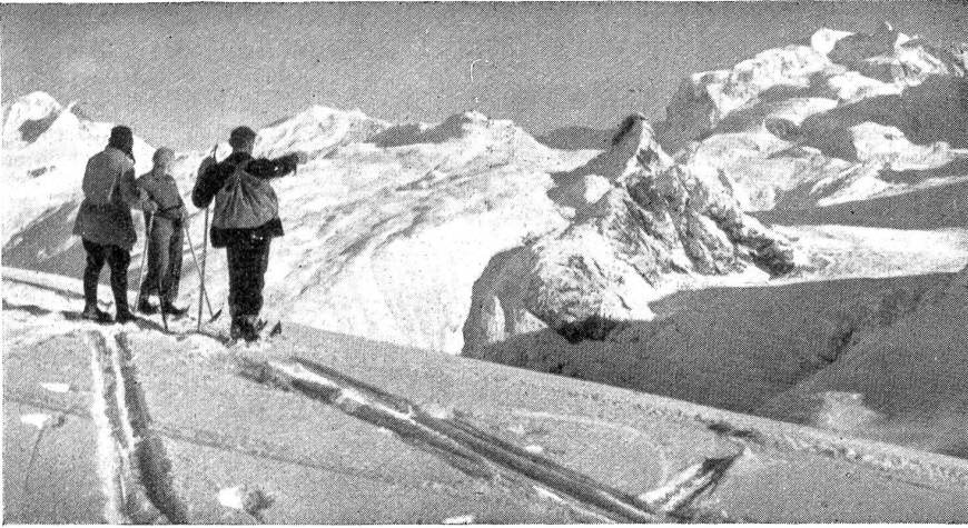
Blick auf Monte Rosa vom Schwarzsee aus.