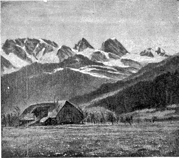
G. Lüscher: Blick von Wattenwil ins Gantrischgebiet. (Bis und mit 2. Dezember Gemälde-Ausstellung im Kasino.)

Der Gwunder isch i der Fründin erscht wieder erwachet, wo si einisch bim Spazieren a mene Herr begägnen sy und d'Hortense se bi dem Atraffen i Arm chlemmt und nachhär so für sich seit: „Was macht jich dä da?“