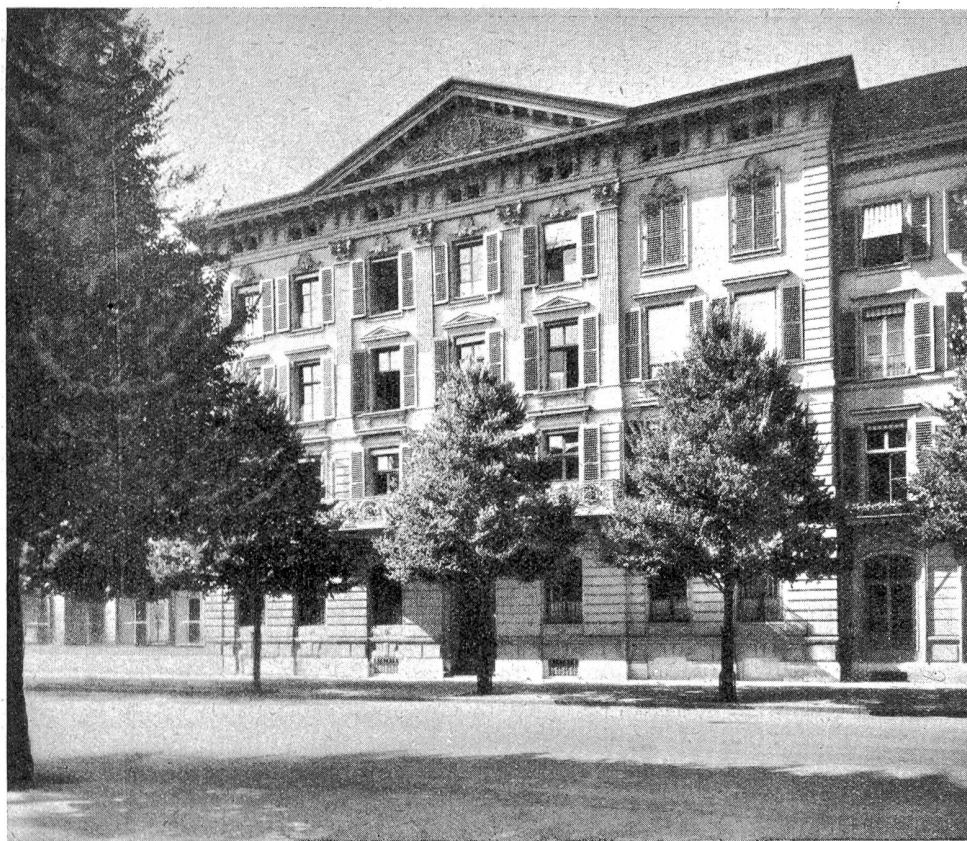
Hauptsitz der Kantonalbank in Bern, Bundesgasse 8, 1869—1906.