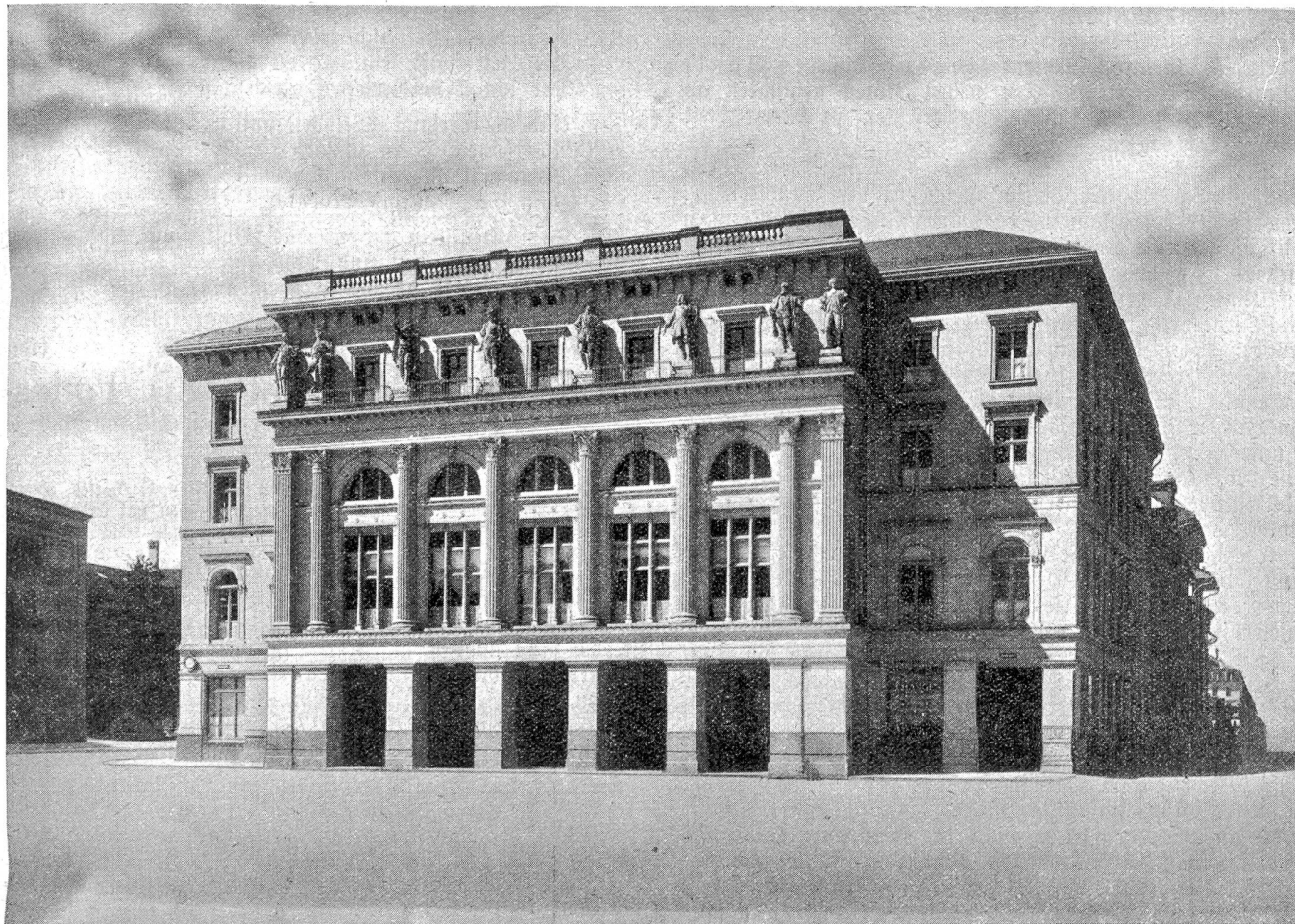
Hauptsitz der Kantonalbank von Bern seit 1906 am Parlamentsplatz. Erbaut 1866—1868.