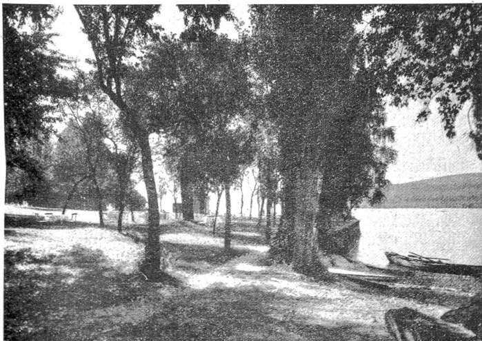
Steckhorn. Am Seeufer bei Glarisegg.