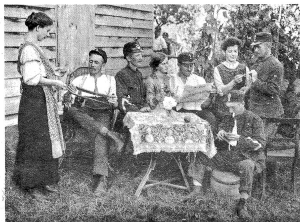
In Aegerten. „Innerer Dienst.“

An den Tagen in Aegerten wurde erst recht mit der „künstlerischen“ Pflege des Gefanges begonnen. Unser Zug besaß ein paar wirklich prächtige Stimmen und die Freude am Singen war groß. Ein kleines Chörli bildete die Kerntuppe. Man stand im Kreise herum und half ungeheißer mit. Die Hausleute hörten ergriffen zu, kargten nicht mit Beifall und Ruhm und spendeten gerne eine Gratisrösti. Was wunder, wenn die Sänger es immer besser und schöner machen wollten und vergaßen, daß sie eigentlich in den „Sternen“ zu einem Bier gehen wollen? Die Mädchen waren auch schuld daran, indem sie Miene machten, den bisherigen Bevorzugten, der schließlich, wenn er auch „Bändel“ trug, doch nur kommandieren und fluchen, aber nicht so schön singen konnte, zugunsten eines „weichherzigen“ Gemeinen fallen zu lassen! Die schwermütige Melodie des sentimentalischen Liedes „G'hörst wie die Glogge lustig lüte, bim bim bam, bim bim bum“, griff gewaltig ans weiche