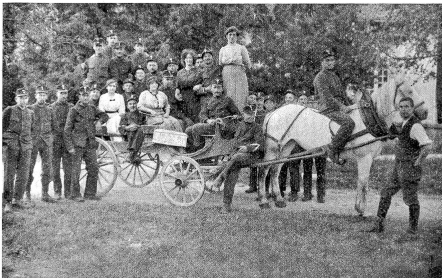
In Aegerten bei der „schönen Pauline“.

Allzu rasch für viele kam das Wiedereintrücken am 8. Oktober. Sofort wurde mit Vorbereitungen für den Abmarsch begonnen. Der Abschied in der Küche des bisherigen Kantonnementes dauerte lange und gründlich. Im Grunde des Herzens war man allgemein doch froh, weiterziehen zu können. Ein milder Oktobertag begleitete uns auf der Marschroute am 9. Oktober über Biel-Neuchâtel-Bern, wo wir, das heißt das 14. Regiment, in Zweierkolonne den Monto erstiegen. Die leise Schwermut des Herbstes, mit seinen satten, goldenen Farben, ließ schon den kommenden Winter ahnen. Für die gebatzenen Strapazen dieses Tages wurden wir auf der Höhe reichlich entschädigt. Jeder von uns war innerlich erhoben und erfreut, als er die Pracht des Alpenkranzes schaute. Vom Tödi bis zum Montblanc leuchteten die Bergriesen in silbernem Glanz. Durch diesen unvergleichlichen Anblick wurden wir neu gestärkt an Leib und Seele, an Willen und Gemüt. Diese weihewolle Stunde veranlaßte unsern Feldprediger, für den nächsten Gottesdienst vom 18. Oktober den Text zu wählen: „Ich hebe meine Augen auf zu den Bergen, von welchen mir Hilfe kommt.“