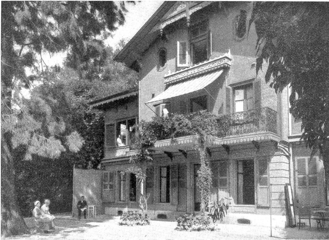
Diakonissenhaus Bern. Châlet Belvoir, Schänzlistrasse 25.

Oder unten in der Hofstube, die Tag und Nacht unser einziger Unterkunftsraum war? Nicht einmal nebenan in der Altkunfernwohnung mußt du dich herumdrücken!“