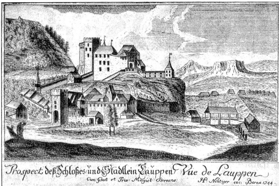
Nordseite von Laupen. Nach einem Stiche der Zentralbibliothek Zürich.

(Klischee aus dem N. Berner Taschenbuch 1925. Verlag K. J. Wyss' Erben Bern.)