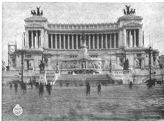
Rom. Monumento nazionale.

Die italienische Landesgruppe der Internationalen Gesellschaft für kaufmännisches Bildungswesen veranstaltete im verfloßnen Sommer einen Wirtschaftskurs in Form eines Wanderkurses, der die Teilnehmer mit den wirtschaftlichen Verhältnissen Italiens und mit dessen Land und Leuten im allgemeinen bekannt machte. Es fanden zu diesem Zweck zahlreiche Exkursionen und Besichtigungen statt. Vorträge