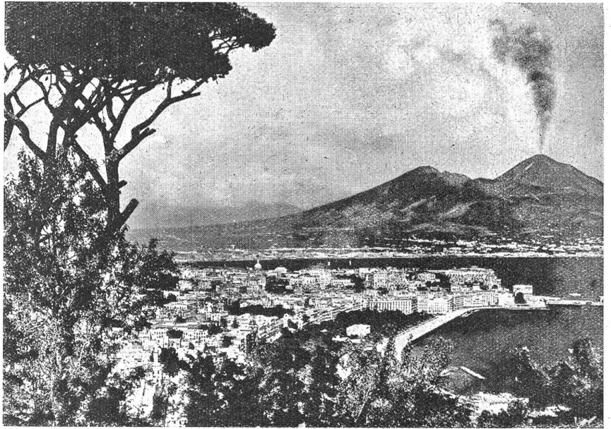
Neapel. Generalansicht mit Vesuv.

milieausfuhr“, „Das landwirtschaftliche Italien“ und „Der Transportverkehr auf dem Lande“ bildeten einige der Vortragsthemen. Großer Beliebtheit erfreuten sich die Stadt-