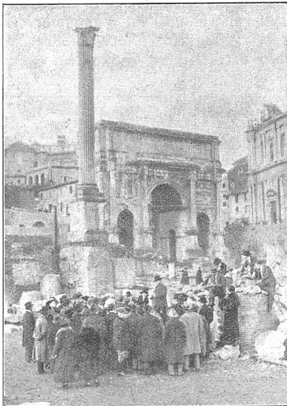
Rom. Ein Sonntagnachmittag im Forum Romanum.

In Rom glänzte während unseres Besuches Tag für Tag wolkenloser Himmel. Richtige Hundstagshitze brütete über der Siebenhügelstadt. Doch die Kursteilnehmer ließen sich nicht unterkriegen. Besichtigungen und Vorträge wurden gut besucht. „Italien vom wirtschaftsgeographischen Standpunkt aus“, „Die italienische Bevölkerungspolitik“, „Der korporative italienische Staat und die Sozialpolitik der faschistischen Regierung“, „Die italienische Obst- und Ge-