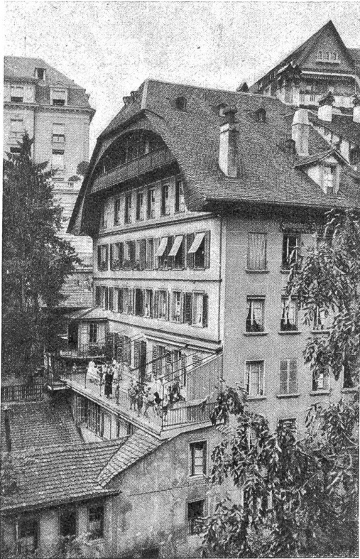
Kinderkrippe Münzgraben Bern (Gründung 1873).

ten und darum jede andere Untersuchung dahinstellen, daß Hans aufs mal Hedwig in den Armen hielt und Hedwigs