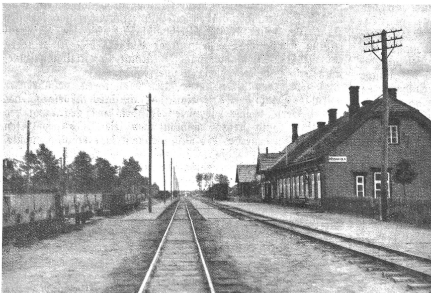
Abend in Mõisaküla (Lettland), Endbahnhof der geschilderten „Nebenbahn“.

Ich setze mich in die Wagenecke, entzünde eine Zigarette. Wird wohl Raucher-abteil sein, Aschenbecher sind ja vorhanden und etwas einzuwenden hat auch niemand, nicht einmal der korrekte Herr gegenüber mit der Brille, von dem ich wetten würde, daß es ein Schulmeister ist. Bald darauf kommt der Schaffner, macht Halt und spricht für mich unverständliche Worte.