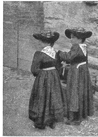
Mädchen von Evolène in ihrer Landestracht.

ins Wallis lockt. Eine Kleinigkeit ist aber so charakteristisch, daß sie einem beständig auffällt: Während die Lärchen bei uns noch grün sind und wohl vor dem Nadelstich etwas gelblich werden, schafft die intensivere Sonnenbestrahlung