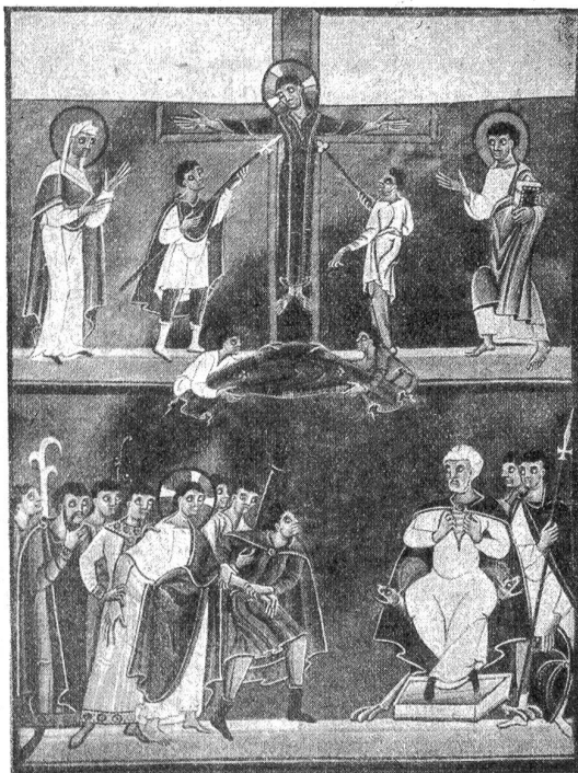
Miniatur aus dem Evangeliar Heinrichs II. (1014).

soviel Erbarmen mit dem Meister, lag soviel Liebe zu dem Gemarterten, daß Jesus, der zu schwach war, ihm zu antworten, ihn ein einziges Mal nur anschaute, aber lange und tief und voll Dankbarkeit, und beider Herzen waren vereint.