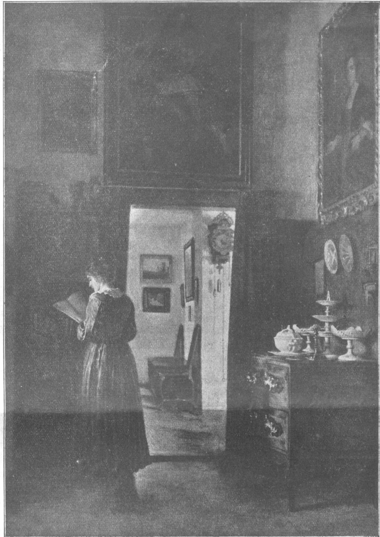
Kieper: heimliche Lektüre.

„Ich habe mich mit ihm über Theater unterhalten; ich verstehe nich, wie Sie zu der Vermutung kommen ...“