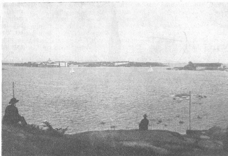
Finnland. Sveaborg bei Helsingfors.

So bietet sich dem Betrachter heute, besonders wenn er sich Helsingfors von der See her nähert, ein Stadtbild, das durch seine typisch nordische, klare Gliederung, durch die strenge Symmetrie der monumentalen Bauten wie eine Entspannung, wie eine Offenbarung wirkt. Diese Klarheit der