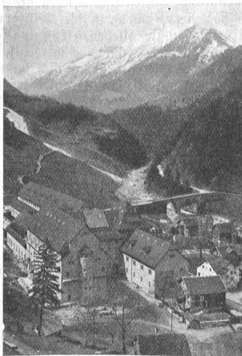
Die Kraftzentrale Amtegg.

Schon das Werden der Gotthardbahn ist ein Zusammenfließen der Völker-solidarität. Nie hätte die kleine