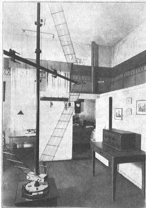
Sunkraum der Deutschen Seewarte in Hamburg.

Auch die wissenschaftliche Erforschung des Meeres ist notwendig, um Seeverkehr und Seewirtschaft zu fördern. In der ozeanographischen Abteilung der Seewarte studiert man die Strömungen, Temperaturen, Salzgehalt und Eisvorkommen. Hier werden unter Verwendung der Beobachtungen der Seeleute, die diese der Seewarte melden, die Oberflächenströmungsarten für alle Ozeane angefertigt, die Atlanten, Segelhandbücher und Dampferhandbücher aller drei Ozeane, die besonders die Temperaturen wiedergeben. Hier werden Einzeluntersuchungen in wissenschaftlichen Fahrten, besonders mit dem Reichsforschungsdampfer „Vesleidon“, dem Vermessungsschiff „Panther“ und dem neuen „Meteor“, dem Fischereischutzboot „Ziethen“ und Schiffen der Reichsmarine unternommen. Hier arbeitet man mit bei der internationalen Ueberwachung des Seeverkehrsweges von Deutschland nach New York. Die regelmäßige Beobachtung des Golfstromes und seiner Schwankungen ist nicht nur für die Meteorologie von großer Bedeutung, sondern auch für die gesamte Fischerei, denn von ihnen hängt es ab, wo die Fischer ihre reichste Beute erwarten können. Das sonderbarste und unheimlichste Zimmer aber für den Laien ist das, das die Gezeiten-Abteilung enthält. Hier werden für alle wichtigen Punkte und Plätze der Welt, für alle Häfen die Zeiten von Ebbe und Flut vorausberechnet. Ein dickes Buch zeigt der Leiter. Es enthält nur Zahlen, Millionen von Zahlen. Das Adreßbuch von Ebbe und Flut für den