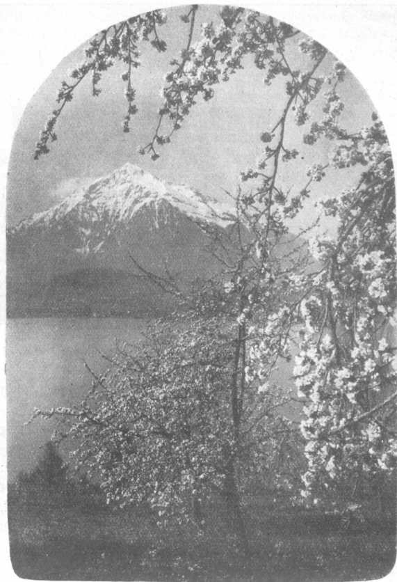
Frühling am Chunersee.

schon. Da war sie ein Metzger, der ein nettes Schlachtschwein an einem seiner Beine gefesselt hielt, und weil sie so grausam war, kam ein Amerikaner und schüttete ihr einen feurigen Trank ein und dann ließ sie das hübsche Schweinchen los und dann goß ihr der Fremde nochmals etwas Feuriges ein und jetzt mußte sie so schnell sie konnte dem entflohenen Schwein wieder nachrennen, obwohl sie gar nicht aufstehen konnte.