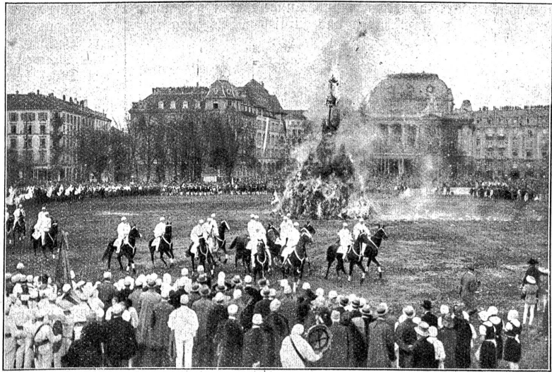
Zürcher Sechseläuten. Der „Bögg“ brennt auf! Bäckerzunft und Beduinen reiten um das Feuer.

Doch als Symbol der gebrochenen Macht des Winters wird das Zürcher Sechseläuten jedes Jahr im April neu auferstehen, wird des Frühlings neue Macht mit Jubel feiern!