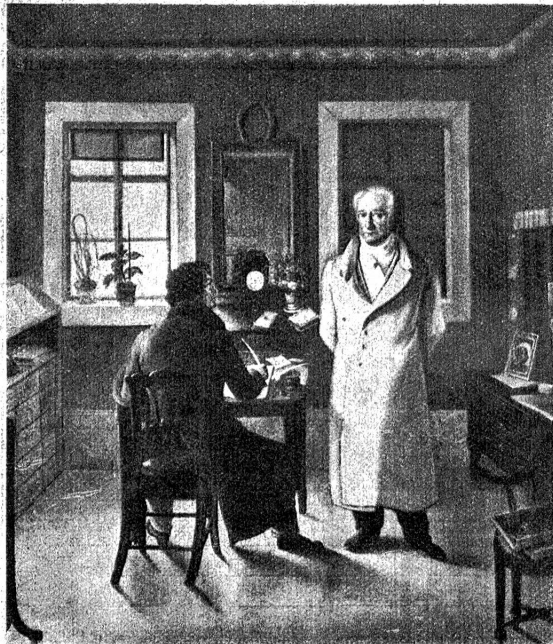
Der 82jährige Goethe diktiert seinem Sekretär in seinem Arbeitszimmer in Weimar.

Er wird die kleine Enttäuschung bald vergessen! tröstete sie ihren eigenen Unmut und sah hinter ihren Gedanken