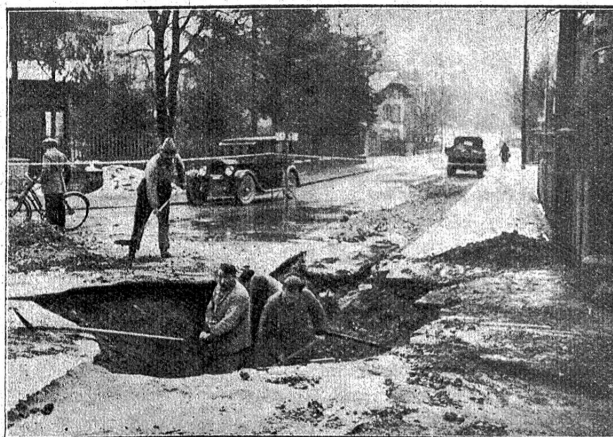
Rein Granatentrichter . . . sondern ein Rohrbruch.

Letzten Samstag den 23. Januar, morgens um 6 1/2 Uhr, brach an der Zieglerstraße ein Rohr der städtischen Wasserversorgung. Das Wasser ergoß sich mit Wucht aus dem Boden hervor und floß in breitem Strom die Straße hinab bis in die Mattenhofstraße. Durch das ausströmende Wasser wurde die Gasleitung unterhöhlt, die dann ebenfalls brach.