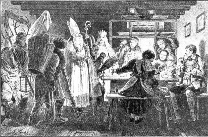
St. Nikolaus in Windischgarten.

nichts, auch jener Bauer ging hinaus, „da packte ihn der Wolf und fraß ihn auf — nur die Stiefel blieben übrig.“