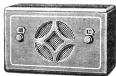
Modell 5 A Fr. 480.—

Es ist für Sie von grossem Vorteil und Wichtigkeit, dass Sie unsere Apparate kennen, bevor Sie sich irgend einen Empfänger anschaffen. Verlangen Sie unsere Radio-Prospekte; unser fachtechnisch geschultes Personal steht Ihnen zur Beratung und unverbindlichen Vorführung jederzeit gerne zur Verfügung.